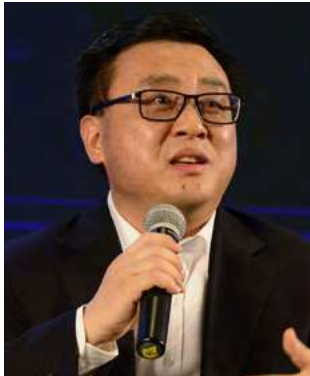
张亚勤：百度公司总裁，CCG 常务理事 Zhang Yaqin: President of Baidu

创 新是要找到跟别人不一样的因素，可以是技术、商业文化、用户的深度理解和敏捷的决策等，中国互联网行业的发展应该是过去五年时间里的一个亮点。但是，全球的互联网企业在海外拓展中都遇到了一些问题，百度也不例外。近两年百度的应对经验是：一是市场选择，尽量选择和中国比较相似的规模大的市场，移动用户要多；二是产品创新，搜索的产品已呈固态，但还可以开发更多移动工具，包括变现平台，为越来越多出国的人提供中国餐馆、旅游景点和中国司机等服务；三是商业模式，除了在一些国家建立分支机构，更重要的是与本地的合作，尤其是投资并购。