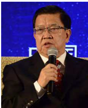
龙永图: 原国家外经贸部副部长、博鳌亚洲论坛原秘书长、CCG 主席 Long Yongtu: CCG Chairman, Former Vice Minister of Commerce

创 新是解决中国企业“走出去”困难的有效方法, 要用创新的思维、创新的方法来思考海外投资过程中出现的一些新情况和新问题, 从而提出创新的解决办法。企业海外投资最重要的是要按照不同地区、不同情况进行创新思维, 设计不同的投资战略和投资策略。企业不断用创新满足新的需求, 需求作为倒逼机制逼着企业创新。例如越来越多的中国自由行游客走出国门, 百度地图就是为满足这一需求而进行的创新。对企业发展的危机感也会驱使企业不断进行创新, 海航就是这样的一个例子, 海航领导正是出于对企业发展的危机感而不断进行创新, 这也是海航这些年快速发展的重要原因。要把创新作为一个重要的驱动力量来推动企业走出去, 同时创新还需要企业家精神。