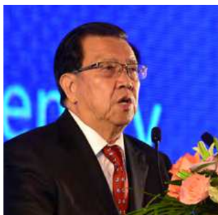
龙永图 CCG 主席、原外经贸部副部长、 原博鳌亚洲论坛秘书长

中国企业“走出去”反映了 中国经济转型的大方向 Chinese enterprises “going global” — an orientation of China’s economic transition.