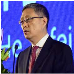
何亚非 外交部原副部长、国务院侨办 原副主任

The new trends and challenges for Chinese enterprises "going global".