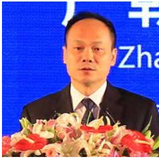
严朝君 三亚市市委书记

Building a fine and happy Sanya 建设精品城市 打造幸福三亚