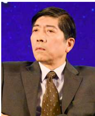
霍建国：商务部国际贸易经济合作研究院原院长，CCG 特邀高级研究员

面对中国企业走出去，我们要好好研究中国企业走出去的新特点，当我们认清这些大趋势和特点时，可以更好地引导中国企业走出去。企业的商业行为是推动中国企业走出去的动力，解决跨越中等收入国家陷阱问题是中国企业走出去的关键。中国企业走出去正在经历一个高速增长的时期，解决企业转型升级也是一个很重要的趋势。而在“一带一路”大战略的实施下，我们要努力打开国有企业跟民营企业联手进行海外投资的新局面，并且继续深入研究很多新趋势。