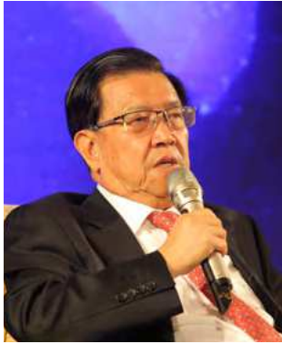
龙永图：原国家外经贸部副部长、博鳌亚洲论坛原秘书长、CCG 主席

Long Yongtu: CCG Chairman, Former vice Minister of Commerce and former Secretary General of Boao Forum for Asia