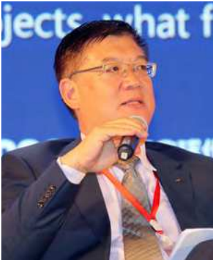
孙维佳：国务院参事室参事业务二司司长

Sun Weijia: Director of the Second Councilors' Office of the State Council