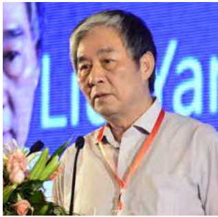
刘燕华，CCG 顾问 科技部原副部长、国务院参事