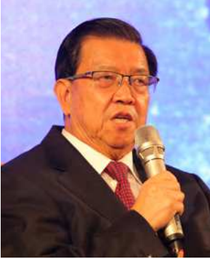
龙永图：原国家外经贸部副部长、博鳌亚洲论坛原秘书长、CCG 主席 Long Yongtu: CCG Chairman, Former vice Minister of Commerce and former Secretary General of Boao Forum for Asia

近 年来中国企业对美国投资大幅度增加，中国企业怎样更好地在美国投资，这是一个非常热门的话题。虽然特朗普先生担任美国总统以后，将会产生很多的不确定性，但是，对于中美投资的影响，积极因素将大于消极因素。特朗普担任美国总统后，中美之间的投资关系总的来说不会受到大的影响，还将会保持其连续性。对于中国企业赴美投资，一定要抱着双赢的态度，而不能从企业自身单方面的利益出发，如果这样，投资将会更容易取得成功。同时，一定要依法办事，对美国的相关法律规定研究清楚后再进行投资。