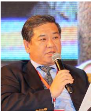
李柏青：三亚市原副市长、CCG 顾问

实 施“一带一路”战略应该以生态文明作为引领。中国在过去几十年的发展过程中，走了一条先污染、后治理的老路，给社会和环境带来了很大问题。现在发展“一带一路”，我们对外要互联互通、促进基础设施建设，包括产能合作，一定要坚持五大发展理念，其中最重要的是生态文明引领。具体来讲，在“一带一路”对外的战略中，一定要采用国际化的生态文明的标准，并一以贯之地推行。