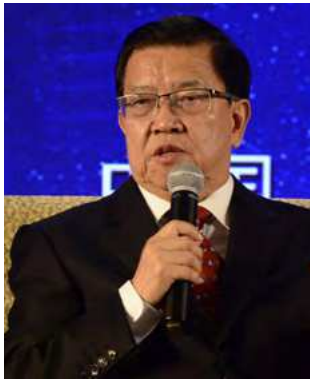
龙永图：原国家外经贸部副部长、博鳌亚洲论坛原秘书长、CCG 主席

Long Yongtu: CCG Chairman, Former vice Minister of Commerce and former Secretary General of Boao Forum for Asia