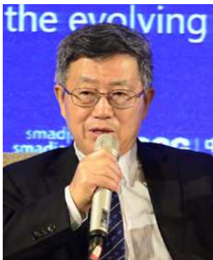
迟福林：中国（海南）改革发展研究院院长、CCG 学术专家委员会专家

欧洲无论从政治关系还是经贸关系来讲，都与中国非常密切。中国企业现在对欧洲很感兴趣，但是必须要注意到欧洲虽然有一点缓慢复苏的迹象，但还是面临着比较严峻的经济形势。大格局上中欧之间的关系如何处理，现在已经到了一个关键的节点。中欧贸易应该全面地看，欧方的贸易应该既包括货币贸易也包括服务贸易，我们的服务贸易是逆差的。在知识产权保护方面，如何保持技术队伍稳定，扩大就业，给社区带来正面的影响，这些都至关重要。欧洲的技术相对开放，中国企业如果资金相对充足，还是有很多机会寻求在欧洲的合作伙伴。