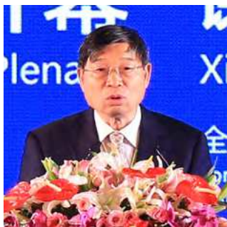
谢伯阳 全国工商联原副主席、国务院参事

Encouraging Chinese enterprises to realize a more diversified global arrangement