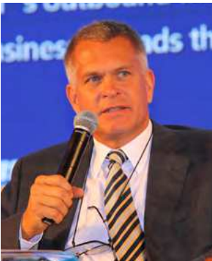
Paul Steinmetz：卢森堡驻华大使 Paul Steinmetz: Ambassador, Embassy of Luxembourg in Beijing (China)

中国企业在过去这些年发展非常迅猛，对外投资空间非常大，今年的对外投资已超过去年全年的水平。现在的中国企业对外投资在投资领域方面也日趋多元化，从过去能源资源类交易，向高新技术服务业多领域发展。对欧美的投资越来越活跃，私募股权也越来越积极。社会责任还是中国企业“走出去”的一个弱项，企业在“走出去”的同时也要为当地的产业和社会发展考虑，这样对于企业更和谐、更顺畅地“走出去”可以起到非常重要的作用。中国企业“走出去”是中国参与全球化的重要力量，中国经济全球化的主要支撑就是中国企业“走出去”，我们要深入思考怎样更好地“走出去”，怎样提升企业“走出去”的质量。