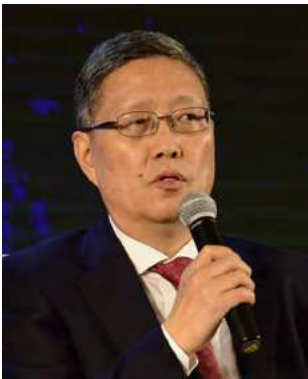
何亚非：外交部原副部长、国务院侨办原副主任、CCG 联席主席 He Yafei: Former vice Foreign Minister

中 国企业“走出去”，首先要进行政策沟通。“一带一路”倡议的第一项就是进行政策沟通，就是将两个国家的发展战略进行比较，找出符合各自发展战略的共同点。这就要求企业在“走出去”之前，认真研究所处的国际环境，研究拟投资国家与中国之间的发展战略关系。中国企业“走出去”需要创新，但除了由强大的基础研究能力支持的原创以外，在很多情况下，将产品和服务做细做精，也是一种创新。中国企业“走出去”需要融合文化，因为世界不同地方的文化差异极大。例如在“一带一路”沿线就有基督教、伊斯兰教、佛教等不同的宗教，处理不好将会阻碍彼此间的合作。企业“走出去”要考虑在文化上面如何对接，这关系到企业在当地能否生存下去。