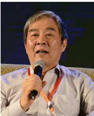
刘燕华：科技部原副部长、国务院参事 Liu Yanhua: Former Vice Minister of the Science and Technology, Counselor of the State Council

中 国企业“走出去”，首先要进行政策沟通。“一带一路”倡议的第一项就是进行政策沟通，就是将两个国家的发展战略进行比较，找出符合各自发展战略的共同点。这就要求企业在“走出去”之前，认真研究所处的国际环境，研究拟投资国家与中国之间的发展战略关系。中国企业“走出去”需要创新，但除了由强大的基础研究能力支持的原创以外，在很多情况下，将产品和服务做细做精，也是一种创新。中国企业“走出去”需要融合文化，因为世界不同地方的文化差异极大。例如在“一带一路”沿线就有基督教、伊斯兰教、佛教等不同的宗教，处理不好将会阻碍彼此间的合作。企业“走出去”要考虑在文化上面如何对接，这关系到企业在当地能否生存下去。