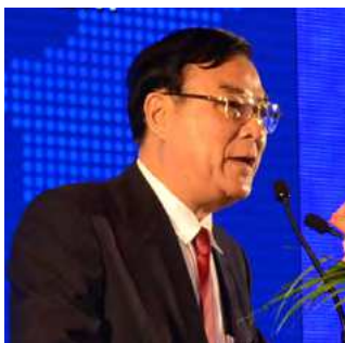
崔明谟 商务部中国国际经济合作学会 会长

企业全球化是中国与世界 经济深度融合的重要渠道 The globalization of Chinese enterprises, a main channel for China to integrate the world economy